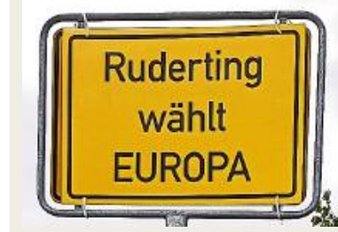
Kreativ: der Wahlaufwurf der Gemeinde Ruderting.

Wie Bürger zur Wahl gelockt werden sollen. Europa wählt – und das sollen alle mitbekommen. Seit Wochen werden Politiker fleißig um die Gunst der Wähler. Doch auch Unternehmen, Gemeinden und Schüler versuchen, die Europäer zu mobilisieren.