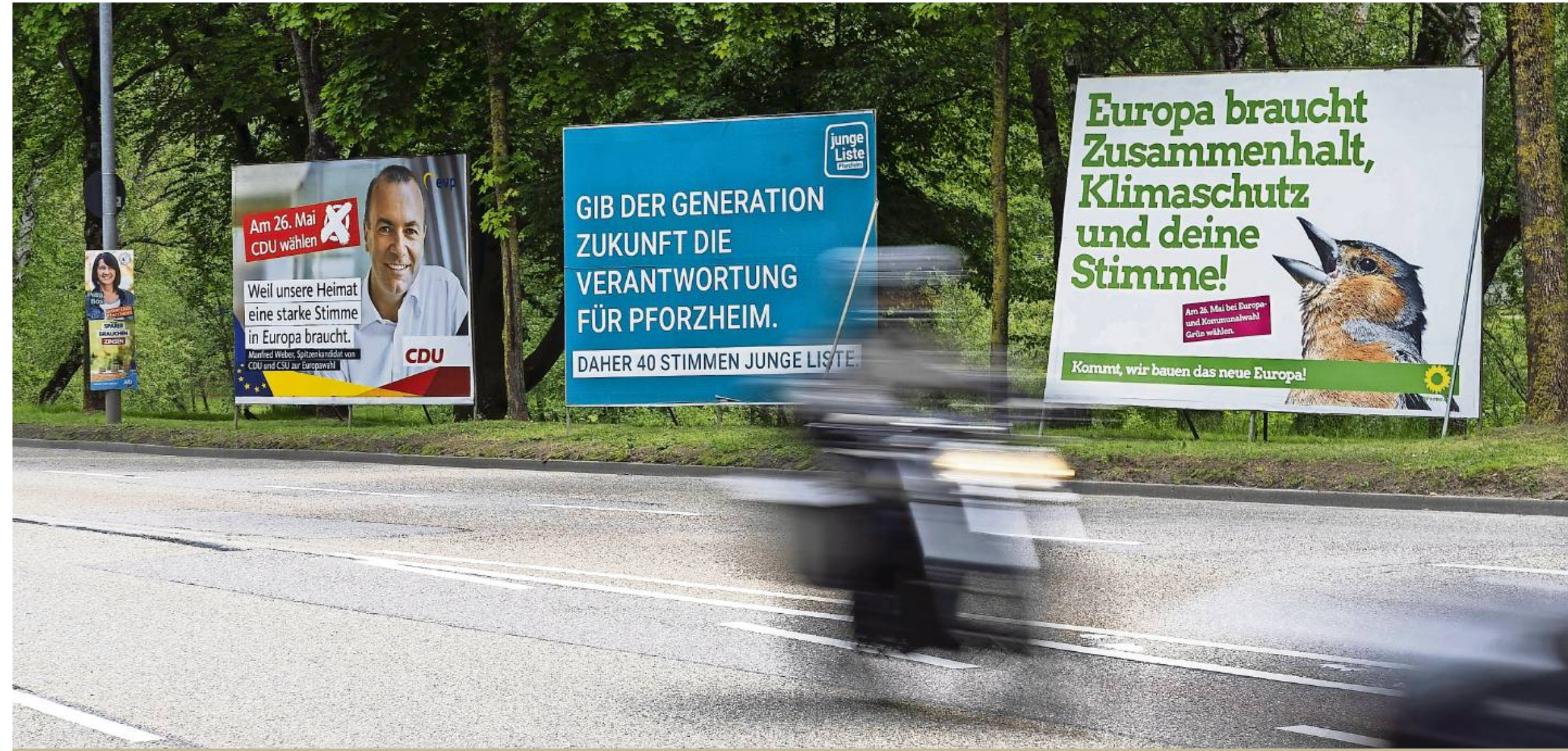
Seit Wochen werben die Parteien um Wählerstimmen – wie hier an der Pforzheimer Habermehlfstraße. Morgen wird sich zeigen, wie wirkungsvoll der Wahlkampf war.

Am 26. Mai ist es soweit: Die Kommunal- und Europawahlen stehen an. Welche Themen spielen eine Rolle? Und welche Kompetenzen haben die Gemeinden und die EU überhaupt? In der Serie „AUF WAHLKURS“ geben die PZ-Volontäre Antworten.