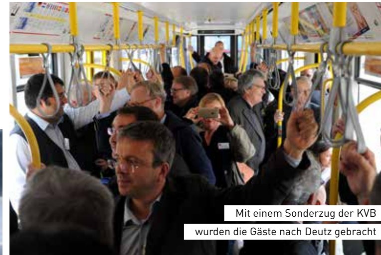
Mit einem Sonderzug der KVB wurden die Gäste nach Deutz gebracht