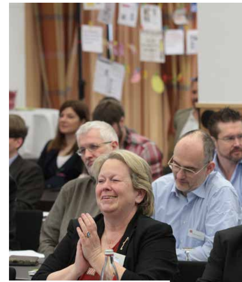
Die Podiumsdiskussion gestaltete sich unterhaltsam

Online-Videos können als ergänzendes Medium interessant sein, um einen zusätzlichen Inhalt zu schaffen. Man muss sich dann nur fragen: Was macht der Journalist vor Ort? Schreibt er, recherchiert er, twittert er, postet er etwas auf Facebook oder macht er Fotos oder Videos? Alles kann er nicht machen. Wir sind bei einer Multimedialität angekommen, die für den Einzelnen einfach nicht mehr zu leisten ist.