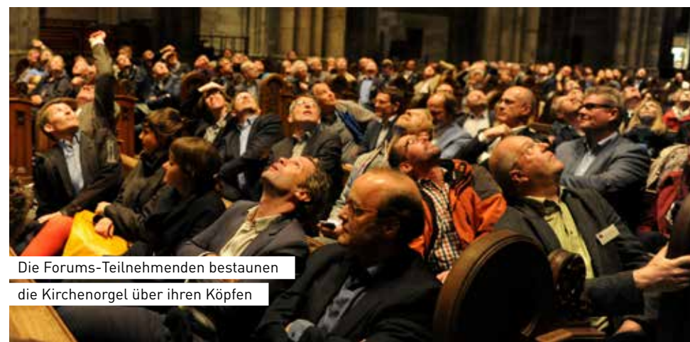
Die Forums-Teilnehmenden bestaunen die Kirchenorgel über ihren Köpfen