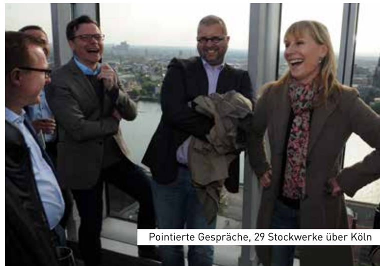
Pointierte Gespräche, 29 Stockwerke über Köln