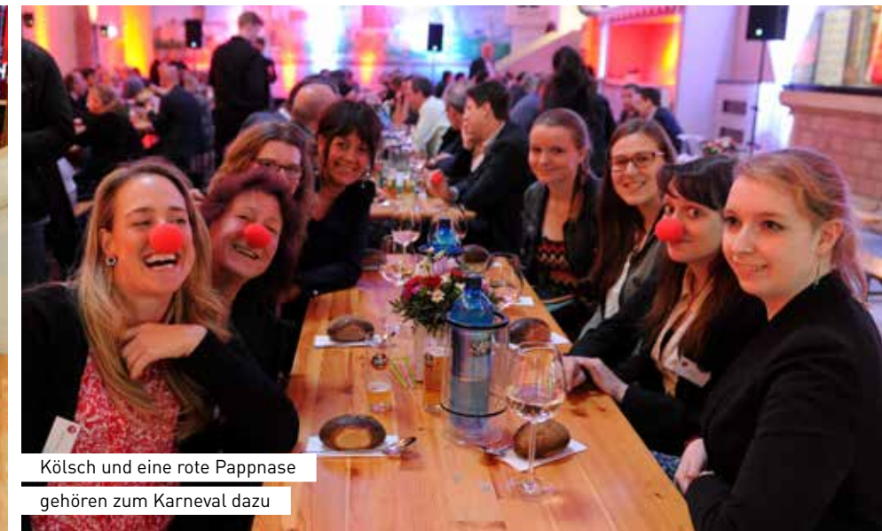
Kölsch und eine rote Pappnase gehören zum Karneval dazu