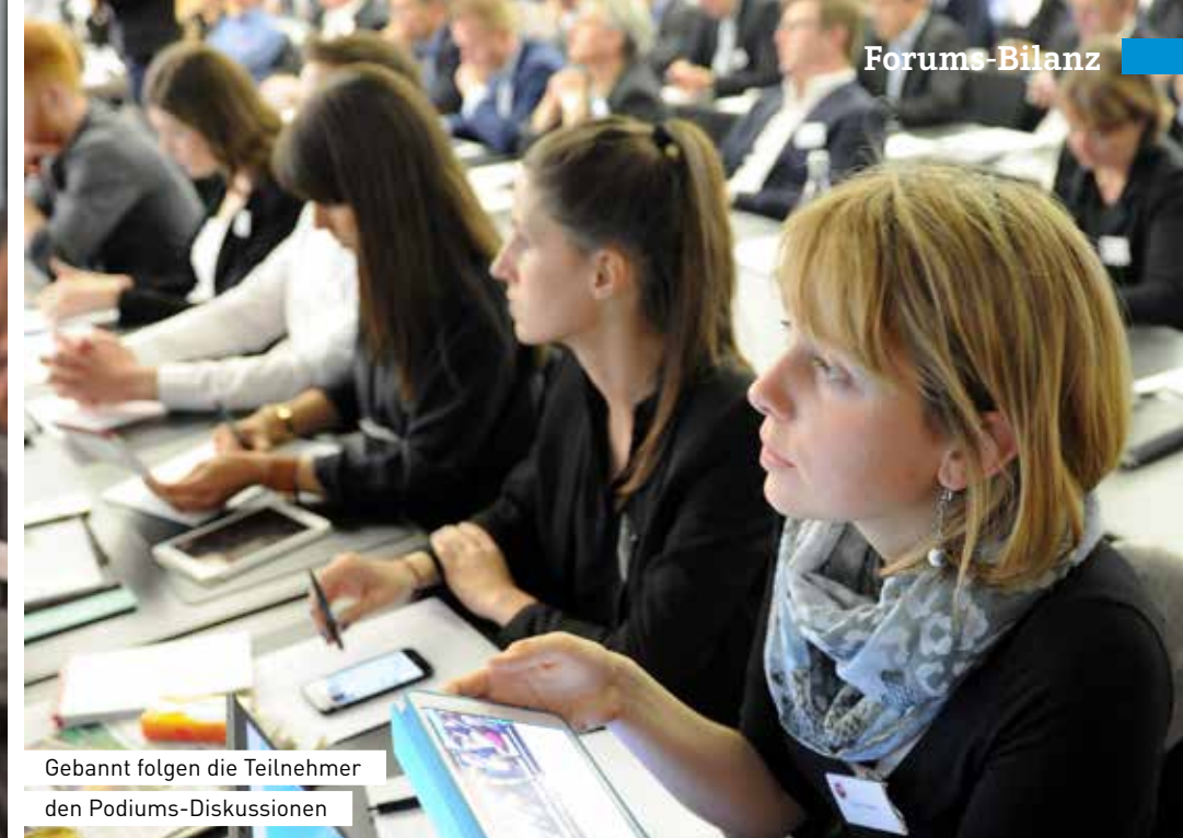
Gebannt folgen die Teilnehmer den Podiums-Diskussionen