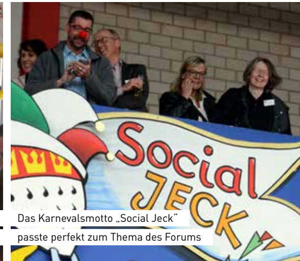
Das Karnevalsmotto „Social Jeck“ passte perfekt zum Thema des Forums